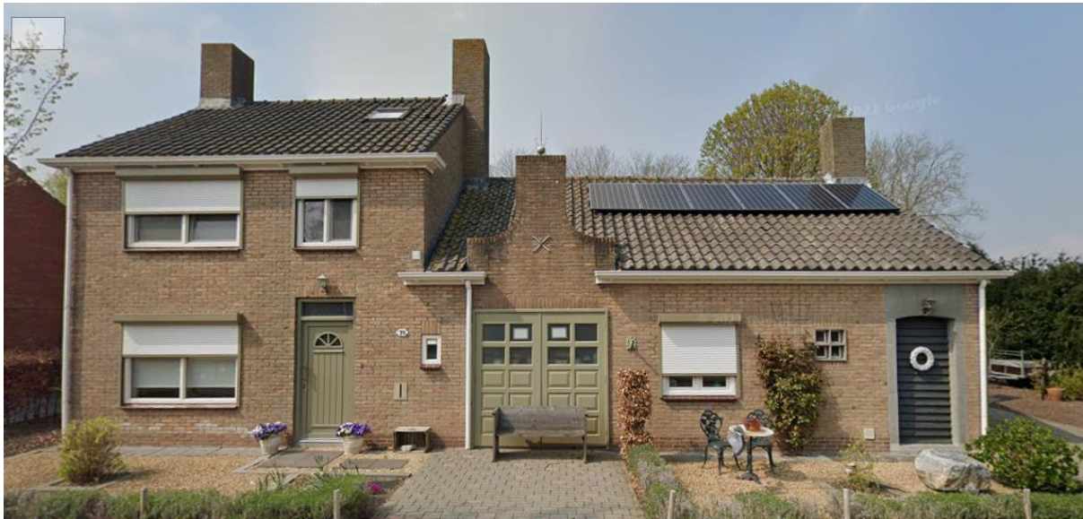
Voormalig bankkantoor Hengstdijk (1958-1964) aan de Hengstdijkse Kerkstraat 7B, anno 2023.