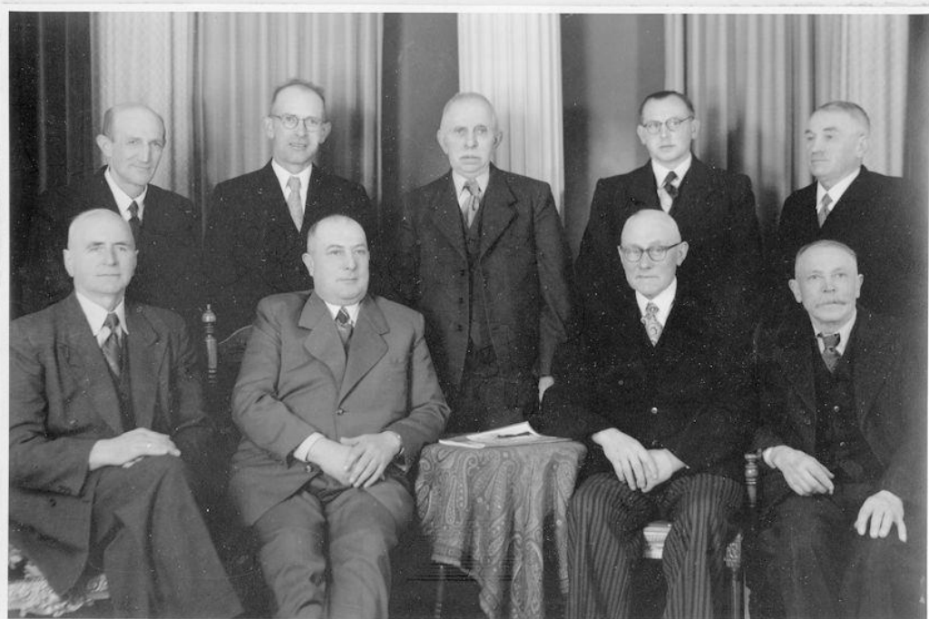
Bestuur en Raad van Toezicht HENGSTDIJK 1953 Coöp. Boerenleenbank